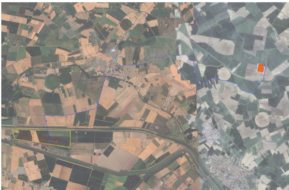
Figura 1: Inquadramento generale su immagine satellitare

L’impianto agrivoltaico, denominato “Molinella”, sarà realizzato in Emilia Romagna, nel Comune di Molinella (BO), in un’area che dista circa 4,5 km dal centro della città (Fig.1). L’impianto sarà collegato in antenna a 36 kV su una nuova stazione elettrica (SE) della RTN a 380/132/36 kV da inserire in entra – esce alla linea RTN a 380 kV “Ferrara Focomorto – Ravenna Canala” e alla linea RTN a 132 kV “Portomaggiore – Bando” per una potenza totale ai fini della connessione di 25 MW. La nuova SE di Terna 380/132/36 kV denominata “Portomaggiore” verrà realizzata nel Comune di Portomaggiore (FE) ed è stata già autorizzata dalla società EG DANTE Srl (Gruppo Enfinity) con provvedimento n. DET-AMB-2024-3386 del 14/06/2024 rilasciato da ARPAE-SAC Ferrara e Decreto VIA N. DM_2024-0000112 del 12/04/2024. Il collegamento tra l’impianto e lo stallo assegnato della nuova SE avverrà tramite un cavidotto interrato a 36 kV di lunghezza pari a circa 13,5 km che si svilupperà lungo strade pubbliche asfaltate ed interesserà i Comuni di Molinella (BO), Argenta (FE) e Portomaggiore(FE).